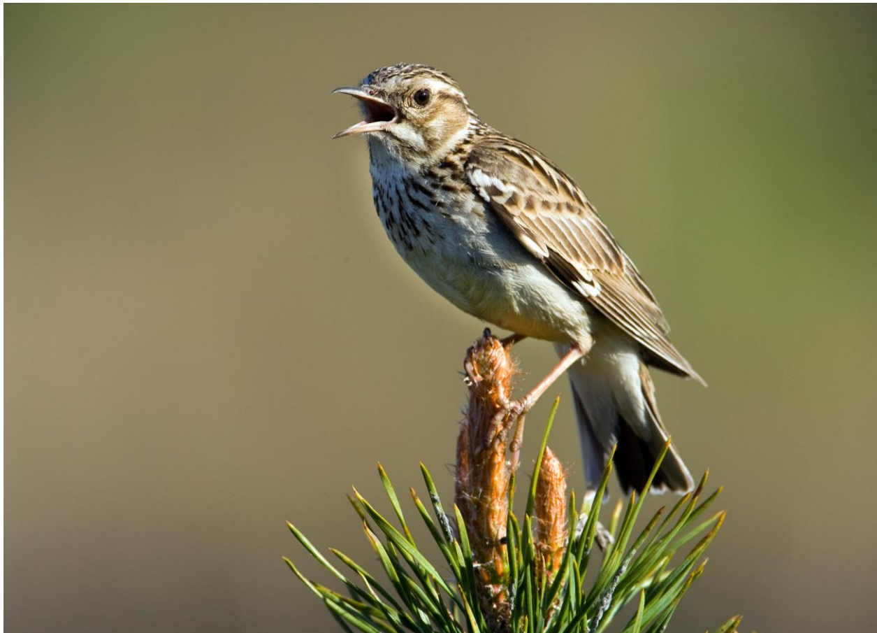
Abb. 1: Heidelerche